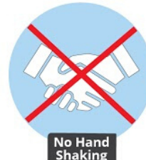
No Hand Shaking

Sneeze or cough into a tissue, or into your elbow; place used tissue in the trash