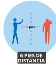
6 PIES DE DISTANCIA

Evite esta área si tiene tos o fiebre o si experimenta síntomas del virus.