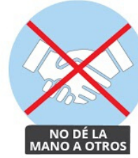
NO DÉ LA MANO A OTROS

Estornude o tosa. en un pañuelo de papel o en el codo; coloque los pañuelos usados en la basura