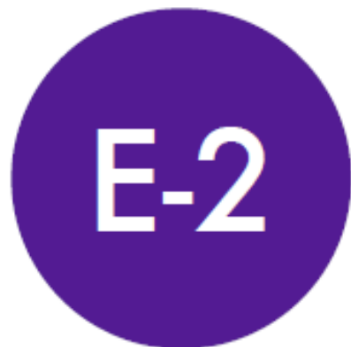
Visto de Investidor