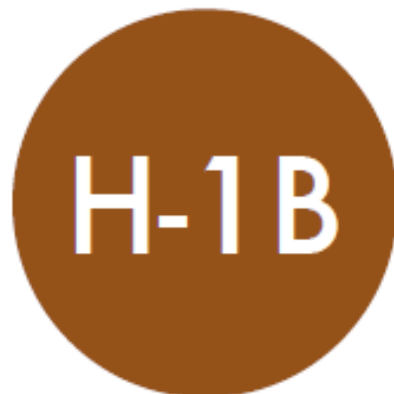
Visto de Trabalho