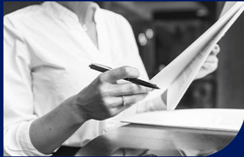
▶ Private Banking