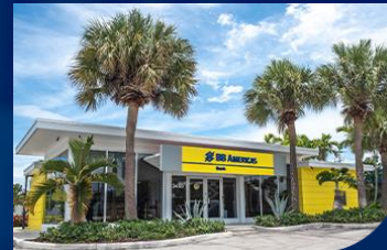
▶ Lighthouse Point