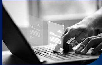
▶ Gov Expats